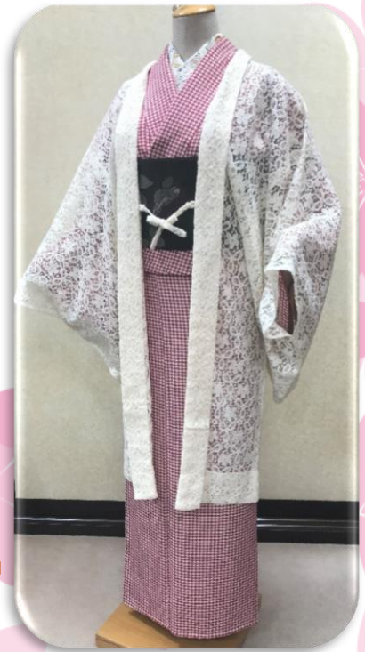
撫松庵 ブレタレース羽織 62,640円 ブレタ衿きもの 30,240円 半幅帯 30,240円