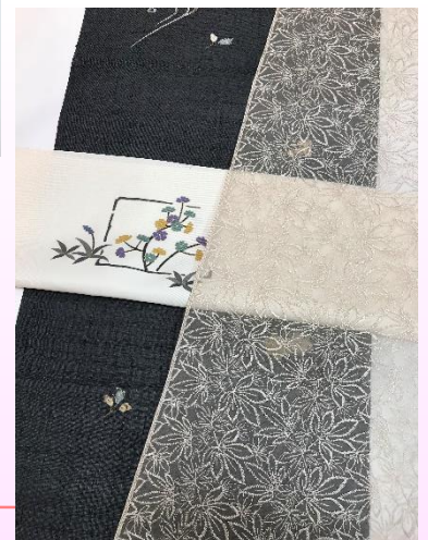
紬きもの着尺 270,000円 塩瀬九寸帯 129,600円 レースコート地 162,000円