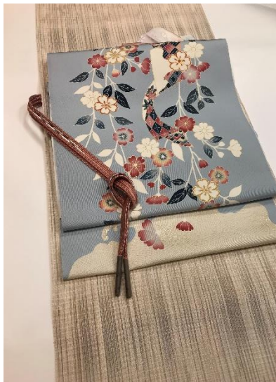
紬きもの着尺 194,400円 塩瀬九寸帯 172,800円 帯揚げ 8,640円 帯締め 25,920円